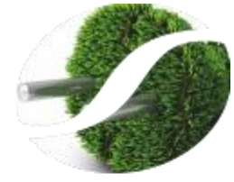
Soluções compensação de energia reativa