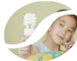
Soluções Iluminação eficiente