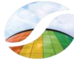
Soluções variação de velocidade