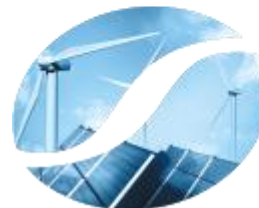
Soluções produção de energia