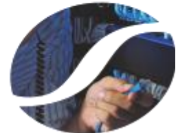
Soluções racionalização de energia em datacenters